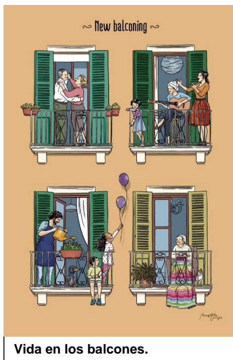
Vida en los balcones.