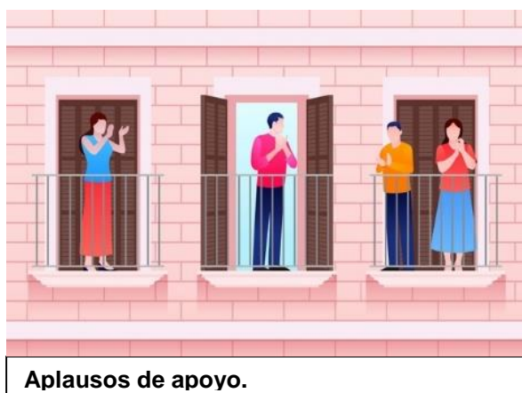
Aplausos de apoyo.