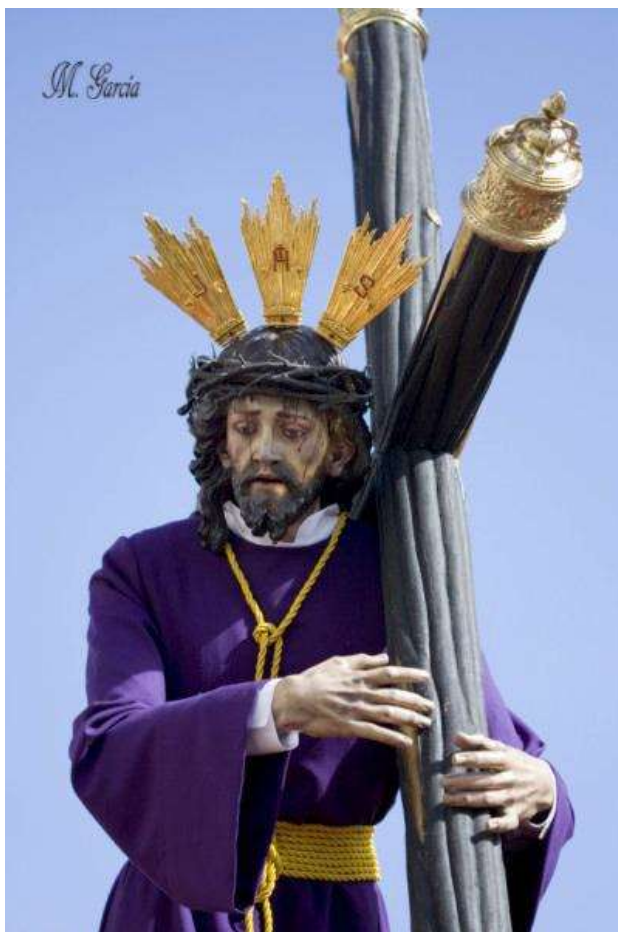
Nuestro Padre Jesús del Gran Poder.