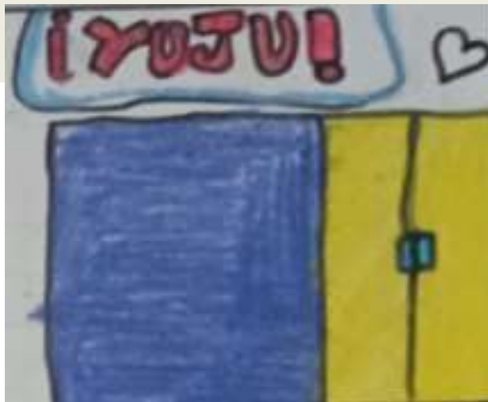
Juguetería ¡YUJU! En la Avda. de Sevilla.