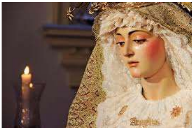
Nuestra Señora de los Ángeles.