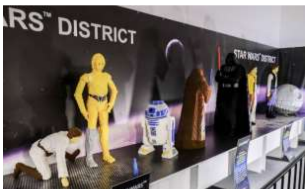
Foto: alguna de las maquetas de la exposición de LEGO