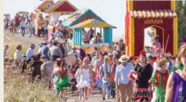
La romería de San Isidro. Los Palacios y Vfca.

La carreta de la hermandad de San Isidro y las carrozas que la acompañan, podrán recorrer las calles de Los Palacios y Villafranca hasta la Corchuela. Saldrán desde la parroquia Santa María la Blanca hasta llegar a la calle Nuestra Señora de la Aurora, calle Real de Villafranca y calle San Sebastián hasta llegar a la capilla que, minutos después, llegarán a la Corchuela. Por la noche, se volverá a la parroquia, donde se dará por finalizado este magnífico día.