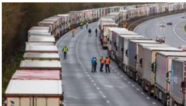
Foto: Carreteras colapsadas por la huelga de camiones.

Por este problema, la gente que trabaja en las fábricas se puede quedar sin trabajo por un tiempo.