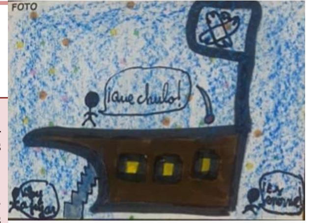
Unos columpios con un gran barco.

Los Palacios y Villafranca ha cambiado porque también están construyendo una piscina y un parque de bombos.