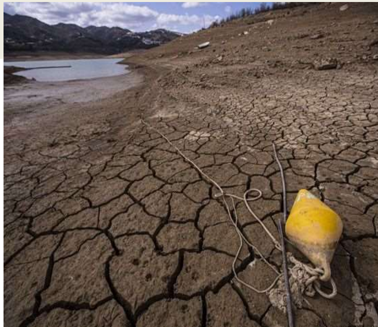
Los pantanos se están vaciando.