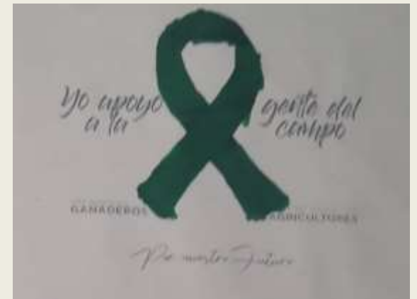
Lazo de apoyo a los agricultores y los ganaderos.

Los agricultores y ganaderos están en huelga por unos precios justos y su propaganda es un lazo de color verde, en el que pone: "yo apoyo a la gente del campo".