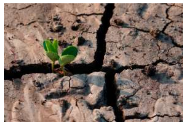
No hay agua para regar.

Los pantanos se encuentran ya a un 28% de capacidad en la cuarta temporada más seca de los últimos 25 años, por lo que la confederación hidrológica del Guadalquivir reducirá al mínimo la capacidad disponible para regadío con 80% menos.