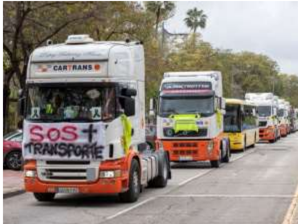
Camioneros en huelga.