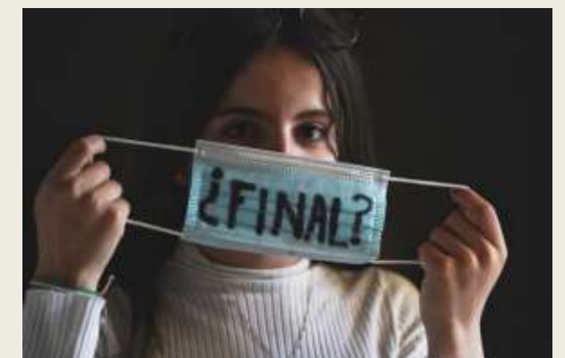
Sin mascarillas en interiores.

Para la semana que viene a lo mejor nos quitamos las mascarillas. Si siguen bajando los casos de covid, a lo mejor nos quitamos las mascarillas en los espacios cerrados, porque afortunadamente está desapareciendo el covid.