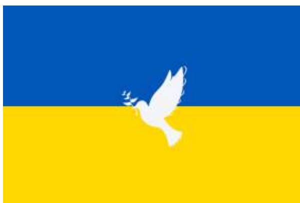
Por la paz en Ucrania.